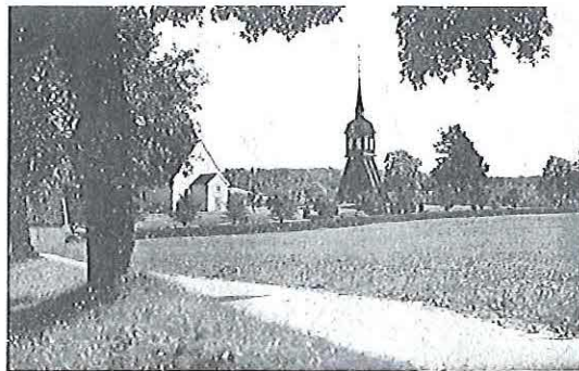
PARTI FRÅN LJUNGARUMS KYRKA.

Ur dalsänkan i norr stiger trädpiplärkan mot höjden på dallrande vingar. Det är hanen, som sjunger för ho-