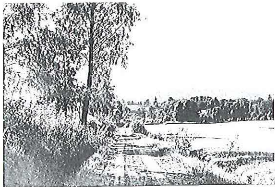
ÖSTER OM LJUNGARUMS KYRKA.